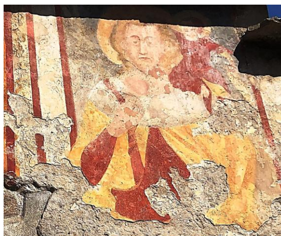
San Giorio di Susa Cappella del Conte

Con la Riforma del Concilio di Trento all'immagine del santo fu attribuito un carattere superstizioso , perché ritenuta una figura leggendaria e non verificata storicamente e quindi la sua