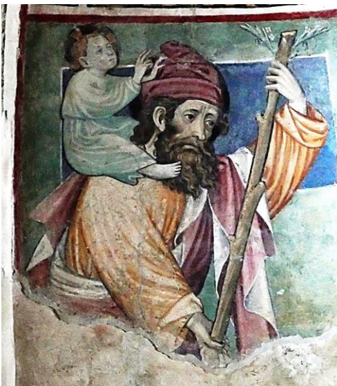
Marentino Chiesa di Santa Maria Assunta

Da quel momento egli cambiò il proprio nome in "Cristoforo" che significa "Portatore di Cristo" . Tornò in Licia dove convertì così tanti soldati che l'imperatore Decio lo fece arrestare ; pur essendo prigioniero, Cristoforo convertì alcuni suoi carcerieri e due prostitute inviate per corromperlo. Subì moltissime torture l'ultima delle quali consisteva nel causargli ferite con il lancio di numerosissime di frecce, ma una di queste cambiò direzione e colpì l'imperatore in un occhio.