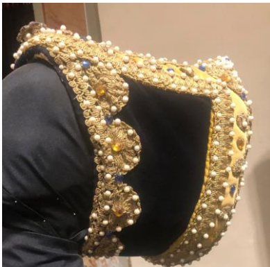
Esempio di ghirlande di perle Asti – Museo del Palio

In questo periodo i copricapi maschili e femminili si arricchiscono : ne esistono a merli, a casseri, a torri, molti ostentano ghirlande di perle .