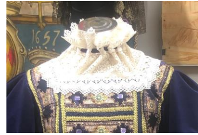
Esempio di colletto a “lattuga”

Si afferma la moda spagnola dei colletti candidi inamidati detti “ lattughe ” su abiti scuri perché si ritiene che conferiscano dignità alla persona.