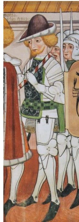
Esempio di abbigliamento militare

Nel tratto iniziale della parete destra dove sono raffigurate le storie della vita di San Fiorenzo , il registro di mezzo nel primo riquadro è rappresentato Fiorenzo chiamato a giudizio : dietro di lui un gruppetto di armigeri in cotta di maglia ben visibile nell'ultimo a destra. Stupendo è il primo personaggio al fianco di Fiorenzo, tutto in armi; il suo abbigliamento è dipinto in modo particolareggiato: si intravede la cotta di maglia , sono dipinte le varie parti dell'armatura e persino i lacci che uniscono i cosciali alla parte superiore, le gambiere ai cosciali e alle scarpe. L'abbigliamento di questo soggetto è un misto di militare e civile, perché indossa un ricco farsetto smanicato , di pregiato tessuto verde lavorato e completato da una originale cintura a scacchi nei colori verde chiaro e verde scuro che richiamano quelli del farsetto. In capo porta il becchetto , copricapo in voga fin dal 1400.