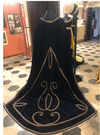
Esempio di strascico Asti – Museo del Palio

La donna nobile e ricca diventa di fatto un manichino da esporre , mentre alle donne “caserenghe” è proibito portare vesti di seta, strascichi e maniche ampie, le meretrici sono obbligate a portare una berretta bianca non di seta, oppure un sonaglio giallo sulla spalla. (Il giallo è considerato il colore della marginalità).