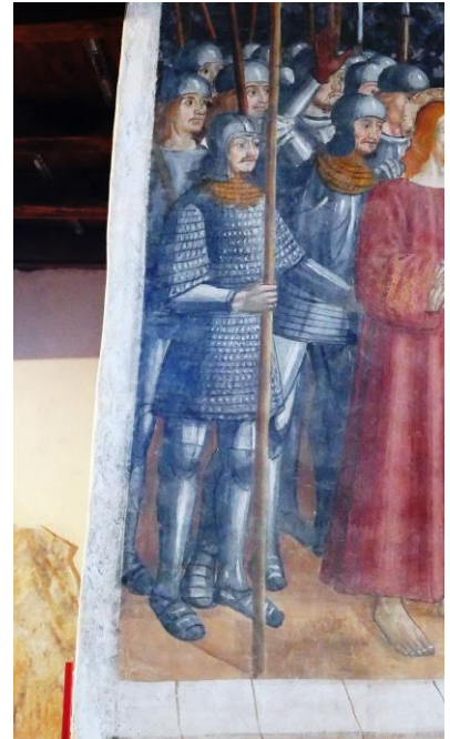
Esempio di abbigliamento militare

Il secondo tipo è la lorica a squame , così chiamata per le lamelle di metallo da cui è formata che messe l'una accanto all'altra, ricordano le squame del pesce. Le scaglie sono piastrine romboidali di ferro o di bronzo, lunghe due o tre centimetri, dotate di fori per permetterne l'assemblaggio e cucite successivamente su un supporto di tessuto . Il sistema permette una facile sostituzione delle scaglie mancanti e consente di costruire corazze di qualsiasi misura.