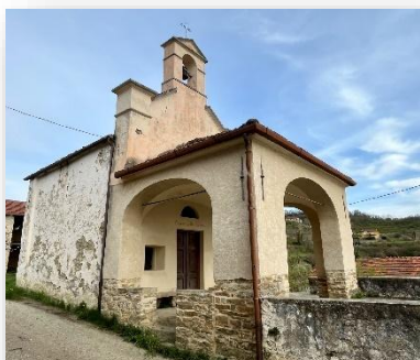
Beata Vergine della Mercede

Di origini seicentesche, la cappella della Beata Vergine della Mercede (detta anche Madonna di Doglio ) presenta un porticato esterno, ricorrente in molti edifici religiosi di ambito rurale e destinato a proteggere i fedeli dalle intemperie.