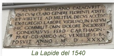
La Lapide del 1540

Intorno al chiostro, dove è stata murata una lapide del 1540 che ricorda il coinvolgimento del territorio nelle guerre tra Francia e Spagna, si trovavano al piano terra gli ambienti di uso collettivo (refettorio, biblioteca e sala capitolare), mentre il piano superiore era occupato dalle celle dei frati; il Convento, oggi sede scolastica, all'inizio del XIV secolo ospitò la Zecca di Cortemilia, istituita dai marchesi Del Carretto.