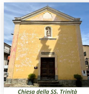
Chiesa della SS. Trinità

La chiesa della Santissima Trinità , antico oratorio cinquecentesco della Confraternita dei Battuti Rossi ricostruito nel 1605, sorge nella piazzetta antistante la chiesa di San Michele: presenta una semplice facciata a capanna con lesene angolari che sorreggono un timpano e un pregiato portone in legno di noce decorato; la nicchia soprastante ospita la statua di un santo.