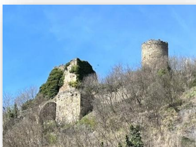
Torre e resti del Castello

Dell'antico Ricetto originario del XII secolo, eretto su resti romani, rimangono solo gli imponenti ruderi che sorgono sul colle sovrastante l'abitato: la Torre cilindrica in pietra alta 30 metri (non visitabile), un massiccio torrione più basso, tratti di mura e resti di edifici.