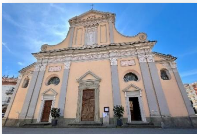
Chiesa di San Pantaleo

La chiesa parrocchiale di San Pantaleo fu edificata contestualmente al borgo medievale omonimo, nel XVI secolo, ma venne rimaneggiata dopo l'epidemia di peste del 1630 e poi nuovamente alla fine dell'800.