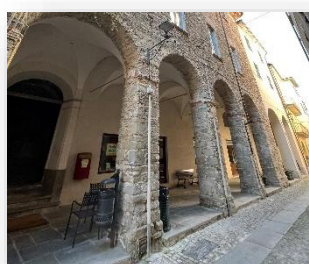
Portici di San Pantaleo

Sui portici medievali del borgo, in via Cavour , si affacciano imponenti edifici dei secoli XVII e XVIII, simboli della solida opulenza delle famiglie nobili e borghesi locali presenti a Cortemilia fino al tardo Ottocento.