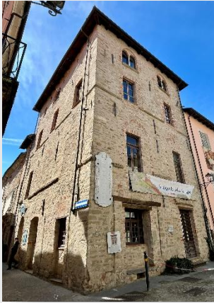
Palazzo della Pretura

Centro del borgo è piazza Molinari : fu l'origine dell'insediamento romano, protetto a sud dal fiume Bormida e a nord dalla rupe su cui sarebbe sorta la fortezza.