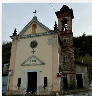
Cappella di San Rocco

Dell'originario impianto seicentesco della cappella di San Rocco , attigua al cimitero, rimane solo la facciata con il portale timpanato, la cornice orizzontale retta dalle due lesene e il pregevole rosone in pietra arenaria; nel 1970, infatti, subì una massiccia ricostruzione.