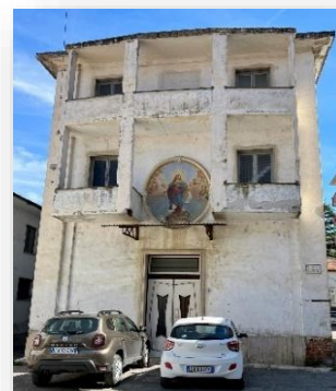
Chiesa della Madonna Assunta

Accanto alla parrocchiale si può osservare un altro edificio, un tempo sede della Confraternita dei Battuti Bianchi: la chiesa della Madonna Assunta ; trasformata in fabbrica nel 1960, l'unico indizio della destinazione religiosa originaria è l'ampio affresco ovale in facciata, che raffigura l' Annunciazione .