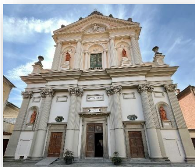
Chiesa di San Michele

La chiesa parrocchiale di San Michele sorge sul sito di un antico monastero benedettino: a causa dei danni provocati da un'inondazione, fu ricostruita nel 1885 su progetto dell'architetto doglianese Schellino e presenta un'armoniosa facciata