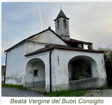
Beata Vergine del Buon Consiglio

La cappella della Beata Vergine del Buon Consiglio (detta anche Madonna di Bruceto ), è documentata già nel XV secolo e presenta un portico con funzioni di riparo dei fedeli, un'aula spaziosa, piccoli ambienti laterali ed il campanile cui si accede da una scala in pietra viva. Pur tenendo conto dei pesanti interventi del 1722, la chiesa conserva le caratteristiche originarie. A poca distanza, nella parte più antica del borgo è visibile un antico edificio, denominato tradizionalmente "Casa dei Frati" con architrave in pietra che riporta il simbolo di San Bernardino da Siena e la data 24 Maggio 1578.