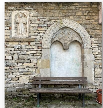
Piazza Rinascita della Valle

L'altro lavoro è una lunetta sovrastante una bifora, dove si trova un'Annunciazione vivace e armoniosa; lo stile sembra richiamare quella del bassorilievo sulla porta di Casa Molinari, ma anche le composizioni di Luca della Robbia (1400-1482).