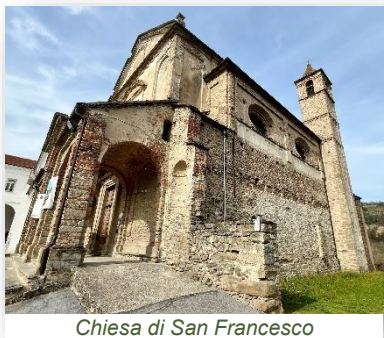
Chiesa di San Francesco

Il complesso di San Francesco è costituito dalla chiesa e dall'adiacente convento; secondo la tradizione popolare venne fondato nel 1223 dal beato Guglielmo Rubone sull'onda della predicazione tenuta da San Francesco d'Assisi che, nel 1213, sarebbe passato dalla Valle Bormida.