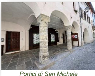
Portici di San Michele

Gli antichi portici medievali di San Michele (via D. Alighieri), recentemente restaurati, presentano colonne e capitelli romanici del XIII secolo in pietra, e diversi archi ogivali. Dove ora sorgono i nuovi palazzi si trovava l'Oratorio delle Umiliate, di epoca barocca, abbattuto negli anni '60.