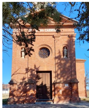
Madonna del Carmine

L'attuale campanile, edificato nel 1903, si eleva sul lato destro, posteriormente.