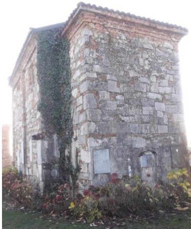
San Vittore (e Corona): abside e fianco destro

Recuperando l'auto ci si dirige al piccolo cimitero del paese, dove si erge la chiesa di San Vittore (e Corona) del XII secolo: del periodo romanico conserva solo parte dei materiali da costruzione.