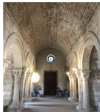
San Lorenzo: interni

La struttura muraria è costituita da blocchi di pietra squadrata, utilizzata anche per le sei cappelle laterali, mentre nell'abside si alternano fasce di pietra e filari di mattoni, ma gli elementi che attirano l'attenzione dei visitatori sono i pilastri cruciformi, gli archi della navata centrale e i capitelli, che mostrano una ricchezza di soggetti ricorrenti nella rappresentazione simbolica medioevale.