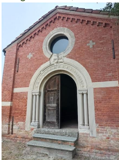
Santi Sebastiano e Fabiano

Lungo la SP2, sulla sommità della collina che precede il borgo, sorge la pieve